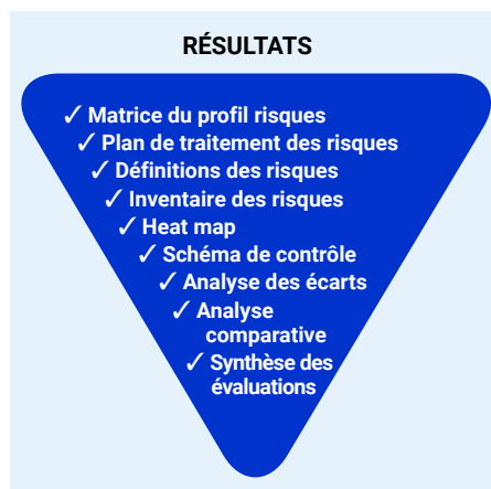
Schéma 3 – Livrables du modèle d'analyse Risk Insight

Votre chef de projet NTT reste à votre disposition tout au long de sa mission pour répondre à vos questions, organiser les réunions et autres tâches formelles. Des ateliers animés par des spécialistes sont également disponibles.